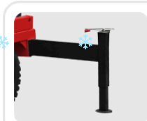
Стальные выдвижные опоры - защита от опрокидывания