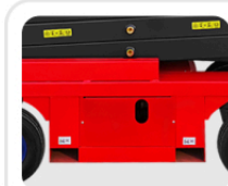
Система аварийного опускания